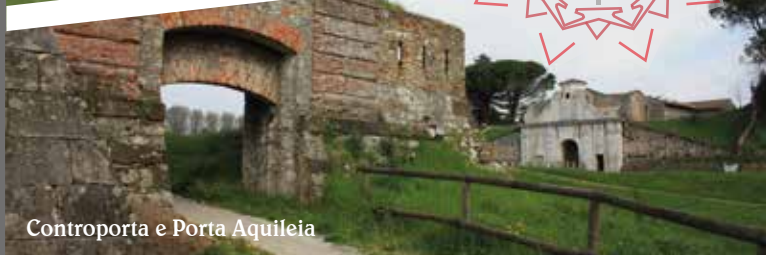
Controporta e Porta Aquileia