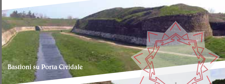
Bastioni su Porta Cividale

> Walking through the main streets and the districts , up to Piazza Grande, the heart of the city. Here you will enjoy the majesty of the square, the Duomo Dogale, the Palazzo dei Provveditori, the Loggia dei Mercanti and the Gran Guardia and the 11 statues of general administrators that surround it.